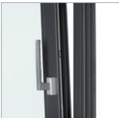
Maniglia prolungata, apertura a ribalta

Integrano e completano la linea METROPOLIS. Molto versatili, adatti ad aperture di media ampiezza, possono ottimizzare ed aumentare l'impiego della superficie abitativa, trasformando verande e terrazze in ambienti chiusi, perfettamente isolati e sicuri, pervasi da luce naturale.