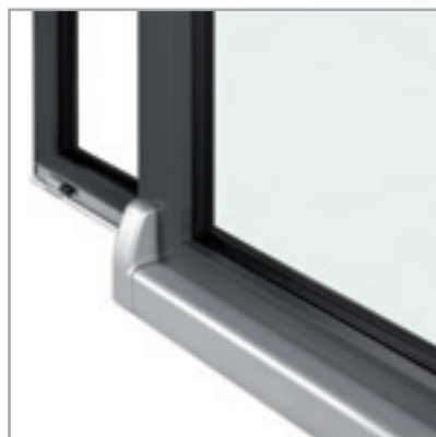
Particolare carter inferiore