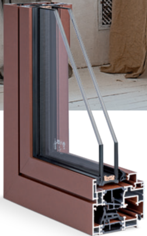
Particolari della sezione interna del profilo Metropolis con fermavetro opzionale linea ferro.