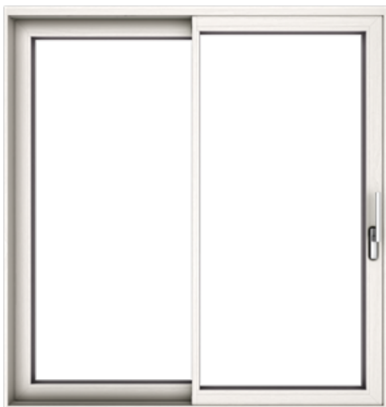
METROPOLIS METROPOLIS PLUS

L'alzante scorrevole Metropolis rappresenta la risposta alle ultime esigenze progettuali. Profili dalle linee semplici ed essenziali incorniciano le grandi superfici vetrate, la cui movimentazione risulta sempre facile, fluida e sicura. Dove si voglia accentuare la continuità visiva tra ambiente interno ed esterno si consiglia la versione SLIM, dal profilo anta ridotto e dal nodo centrale di soli 40mm.