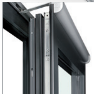
Particolare superiore in apertura